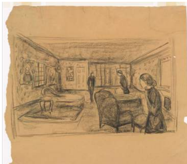
Edvard Munch, Gjengangere. (1928-1929)

Scenografi er et scenisk element som understøtter regien. Noen ganger illustrerer scenografien miljøet scenen utspiller seg i, andre ganger kommuniserer scenografien mer abstrakt eller symbolsk og har sine egne kommentarer til tematikken i teksten. Les Vedlegg 2 (Ibsens sceneanvisninger)